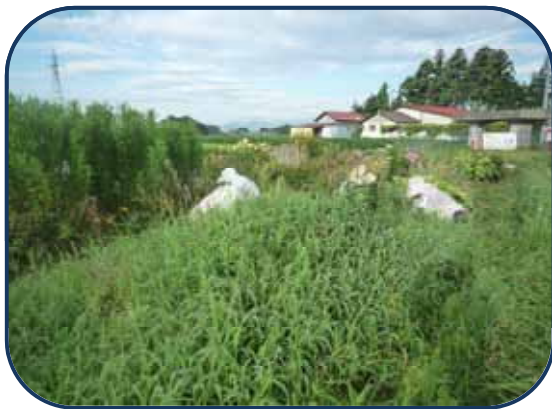
東 花 だ ん