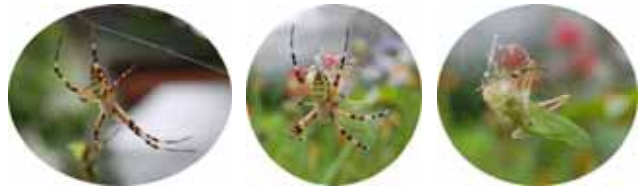
糸にかかったキリギリスを食事中的コガネグ