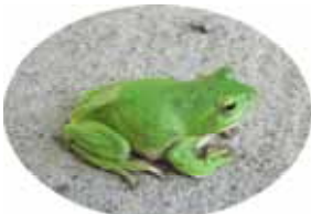
シュレーゲルアオガエルと冬眠をまつ擬態したアマガエル