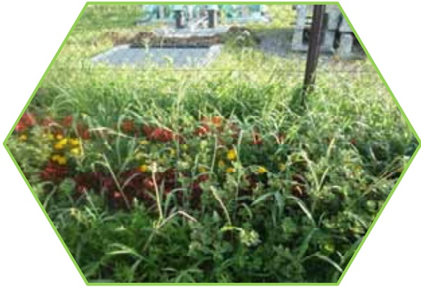
機 場 周 辺