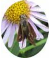
イチモンジセセリ