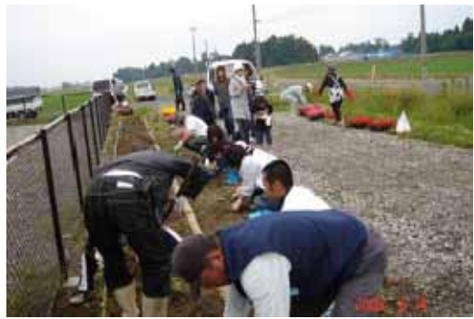
話を聞いてから 始めて下さい。 よく分かりましたかあ～～。