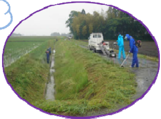
雨の中 ごくろうさまでした