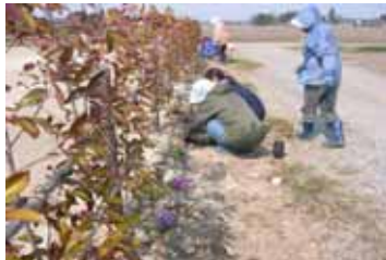
ぐいぐい引っ張り