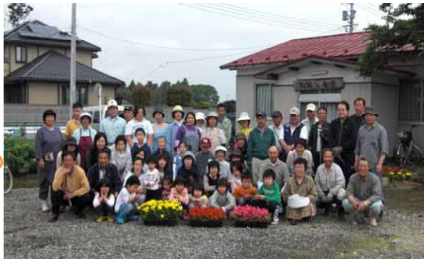
総勢61名の参加！ 天気にも恵まれ作業終了後の皆さんの顔も満足気