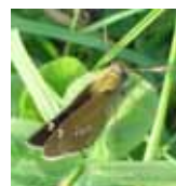
オオチャバセセリ