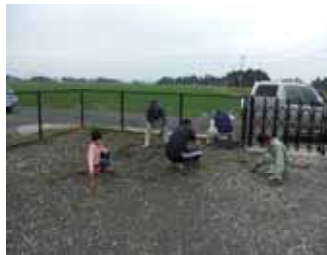
機場内もさっぱりしたでしょう