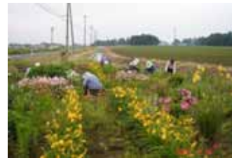
ひがし花壇にも別れて 草をとりました