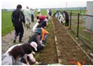
頭の数だけはかどります