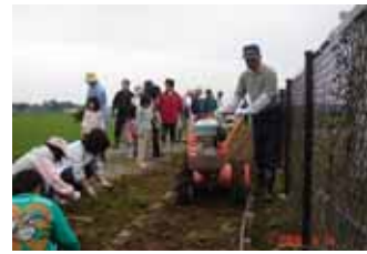
ここ掘れ わんわん 深く掘れ！！