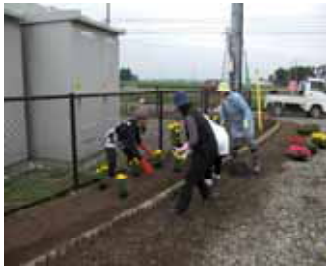
ここにも ひとつ 下さい