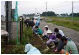
開始前から始まりました