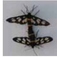
カノコガ (ハンコチョウ)