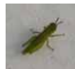
イナゴ 上 幼虫8mm 下 成虫3cm