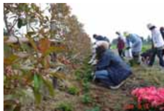
私たち遅れてるようだよ