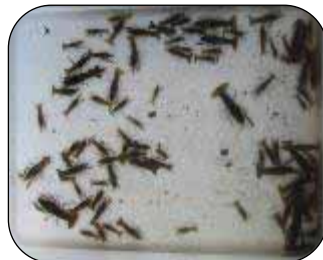
いっぱい捕れたザリガニ