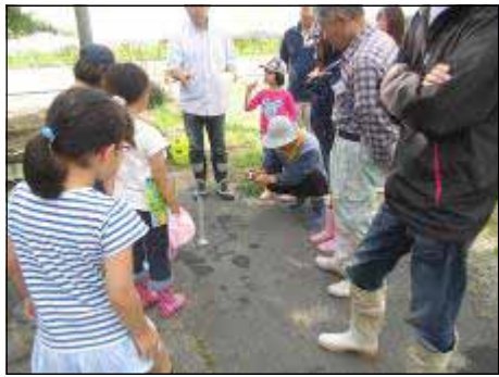
水質検査もしっかり行って