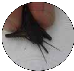
エンマコオロギのオス(左)とメス(右)