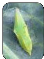
モンシロチョウの蛹