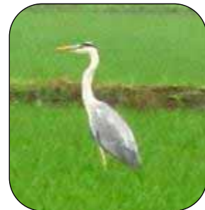
田んぼにいた白鷺