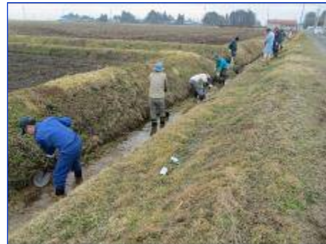
開水路① 公会堂から新田に向かう水路と大場様宅後ろから神社に向かう水路